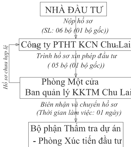
Sơ đồ 3.2 – Giai đoạn tiếp nhận hồ sơ