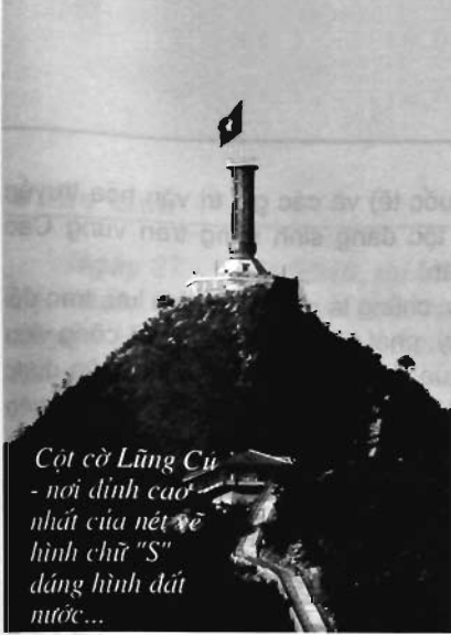
Cột cờ Lũng Cú - nơi đỉnh cao nhất của nét vẽ hình chữ "S" đáng hình đất nước...