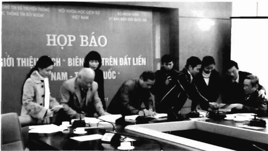
Tập thể các tác giả ký tặng sách các độc giả đầu tiên

Với mục đích phổ cập rộng rãi trong nhân dân, Cục Thông tin Đối ngoại, Bộ Thông tin và Truyền thông (TT&TT) phối hợp với Ủy ban biên giới quốc gia, Bộ Ngoại giao và Hội khoa học lịch sử Việt Nam đã giới thiệu cuốn sách "Biên giới trên đất liền Việt Nam - Trung Quốc" do GS. Vũ Dương Ninh chủ biên.