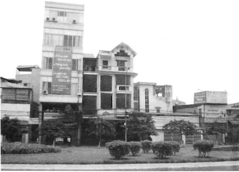
Các ngôi nhà trên tuyến phố Văn Cao cũng không có một phong cách kiến trúc nào của "đô thị hiện đại"

người ấy xây dựng, các tuyến đường mới mở, đường chưa xây dựng xong thì các ngôi nhà đã được người dân nhanh chóng xây dựng cho mình một ngôi nhà với các kiểu dáng kiến trúc..." trăm hoa đua nở".