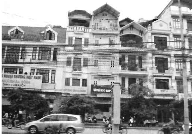
Nhân dân tự xây dựng nhà ở của mình không theo một văn luật nào cho kiến trúc tuyến phố đô thị- Phố Văn Cao- Hà Nội