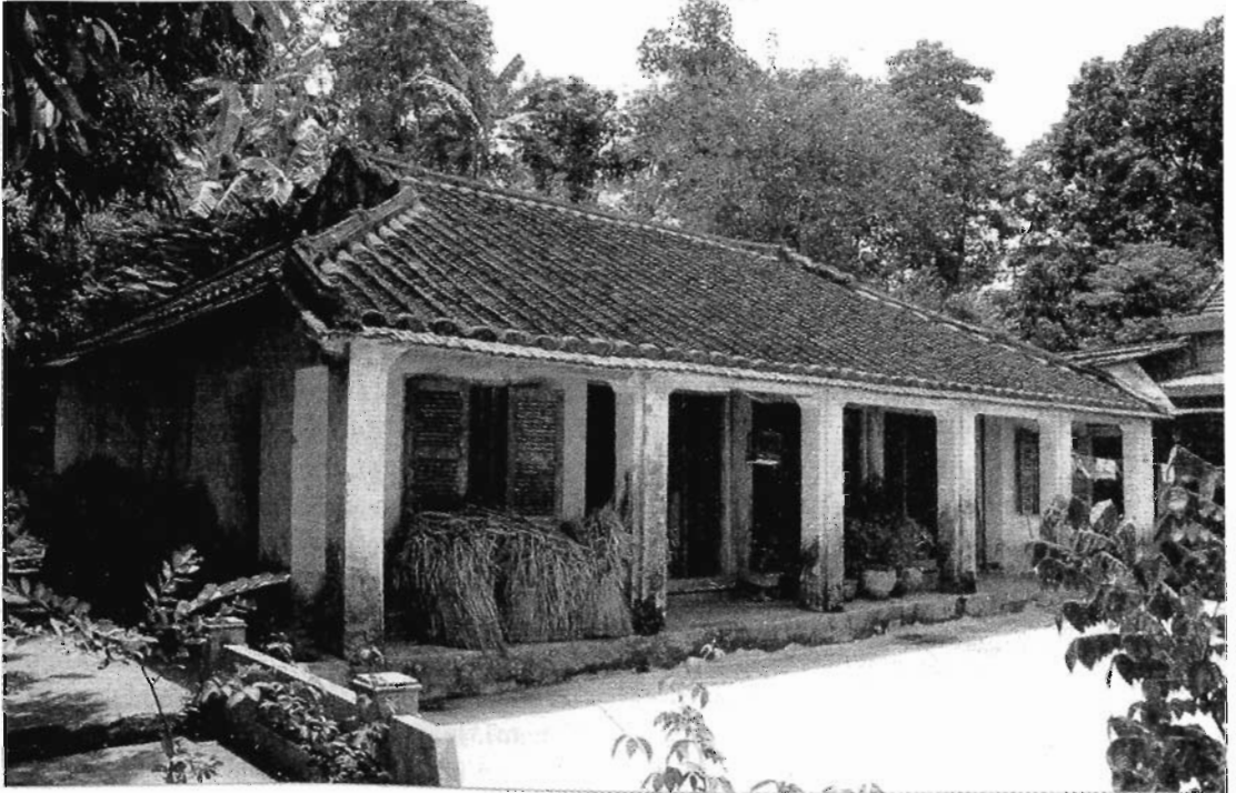
Một ngôi nhà cổ còn lại ở Lộc Yên

Qua khỏi những bờ ruộng bậc thang hướng lên Gò Đồi, nơi đây là không gian sống mà vườn đồi với cây lá, bờ đá, ngõ đá tạo nên trong không gian với màu xanh của cây vườn bao phủ làm cho mái ngói nâu đỏ của những ngôi nhà cổ nổi bật lên, tăng thêm sức quyến rũ và sự ấm áp của mùa đông, sự mát lạnh của mùa hạ. Đặc trưng của việc bố trí mặt bằng tổng thể khu vườn đồi ở đây là các bờ đá, ngõ đá và cả lối đi bằng đá. Làng Lộc Yên cũng như các làng khác ở vùng trung du Tiên Phước có cách khai thác và tạo dựng vườn bằng kỹ thuật xếp đá công phu và độc đáo. Kỹ thuật xếp đá tự nhiên, không phải gia công phức tạp như cắt, xẻ, tạo thành bờ tường không quá cao (từ 1m đến 1,2m) theo kiểu đế lớn chóp nhỏ dần, viên lớn ở dưới, viên nhỏ ở trên gài đan xen không cần xi măng nhưng vẫn vững chãi. Cây cỏ, địa y có