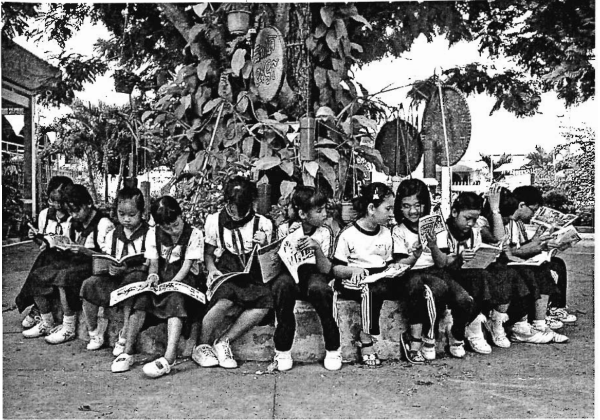
Các bạn nhỏ rất say mê đọc sách.