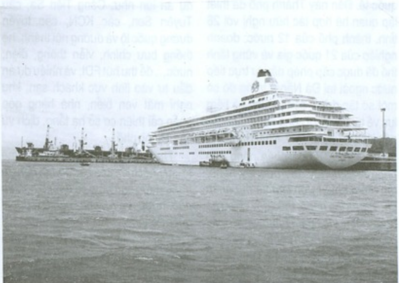
Tàu cập cảng Tiên Sa - Đà Nẵng

Tính đến 31/12/2006, ngành công nghiệp có 67 dự án với tổng vốn đầu tư 485,1 triệu USD, vốn thực hiện đạt 206,2 triệu USD; ngành dịch vụ có 25 dự án với tổng vốn đầu tư 409,3 triệu USD, vốn thực hiện 142 triệu USD. Năm 2005, lĩnh vực sản xuất công nghiệp xây dựng đạt doanh thu 105 triệu USD, giá trị xuất khẩu đạt 84,9